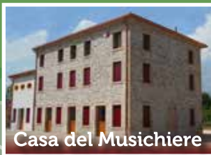
Casa del Musichiere