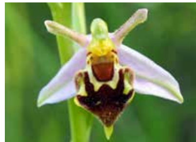
OPHRYS APIFERA var. aurita

La ricchezza e la variabilità di questo habitat ha permesso l'evolversi di ben ventiquattro specie di orchidee, fatto estremamente eccezionale per un territorio, tutto sommato, abbastanza limitato.