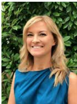
ASSESSORE ALLA CULTURA