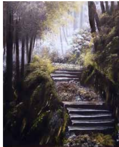
SENTIERO DI LUCE olio su tela cm 40x50

Dipingo un "pieno" per rappresentare "un vuoto". Il quadro, quale arte muta, inizia quindi a gridare a gran voce dei concetti pesanti e profondi, dei valori perduti, come le foglie portate via dai rami in autunno».