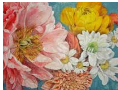
AUREA, 2019 acrilico su tela cm. 162x122

linguaggio universale come la musica, altra protagonista con i suoi silenzi. La pittrice riversa sulla tela il risultato di una lunga riflessione esistenziale dove i fiori diventano il frutto del suo cambiamento interiore. Un cammino personale non sempre di facile comprensione, motivo per cui si è scelto di parlarne attraverso i versi e le note più affini alla sua natura. Non una mostra né una presentazione, ma un evento artistico che si snoda dall'11 al 26 gennaio capace di parlare di voi stessi.