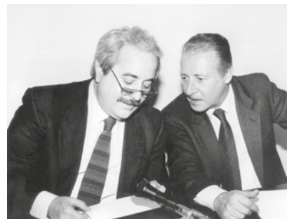
Il giudice GIOVANNI FALCONE e il magistrato PAOLO BORSELLINO

Con mafia si indica una qualsiasi organizzazione criminale di persone che impone la propria volontà con mezzi spesso illegali, per conseguire a fini privati anche a danno degli interessi pubblici. La mafia non è solo un insieme di organizzazioni criminali: è anche cultura che fonda e regola le relazioni personali sull'esercizio sistematico della violenza e dell'intimidazione, sull'omertà, sulla segretezza, sulla trasformazione dei diritti in favori, dei cittadini in sudditi.