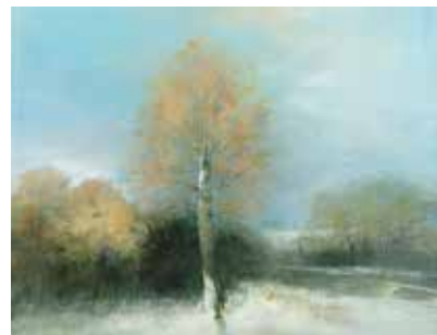
RISVEGLIO 2018 tecnica mista su tela cm 80x80 (particolare)