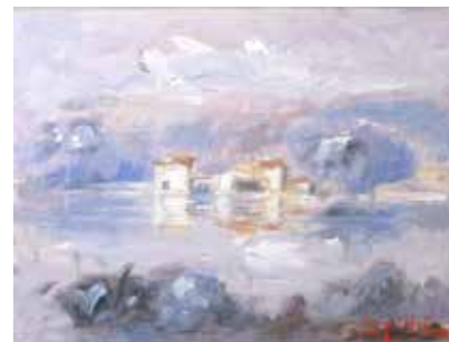
IMPRESSIONE A LAGO (REVINE) olio su tela cm. 24x30

Contrapposizioni cromatiche che giocano tra loro, talora sfiorandosi, nella resa sfocata della figura per lasciare spazio al ricordo, a volte nostalgico, di un paesaggio impresso nel cuore, ancor prima che negli occhi, di chi sa ancora guardare oltre il semplice apparire.